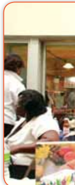
敬源花粉 102 歲為王媽媽，女兒