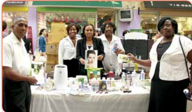
Colin & Associates 介紹了淨水設備維生素以及補品護膚品和綠色產品