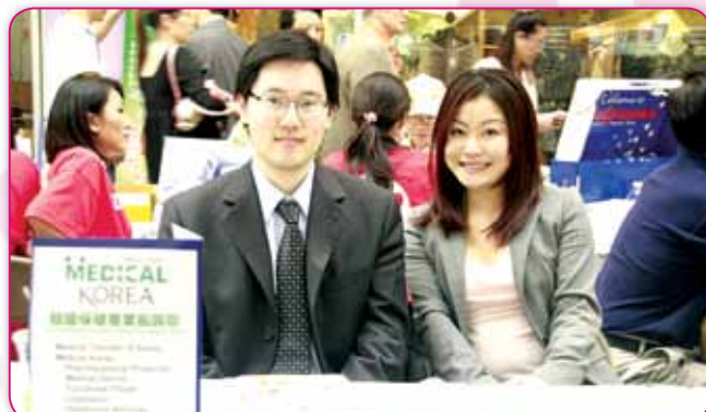
韓國保健產業振興院 The Korea Health Industry Development Institute (KHIDI) 曼哈頓負責人和員工介紹他們的醫療藥品、設備、功能食品和健康服務