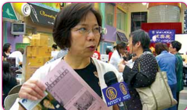
帕克日間成人護理中心 Parker Jewish Institute for Health Care & Rehabilitation 負責人介紹該中心健全的服務可以成為華裔老人的樂園