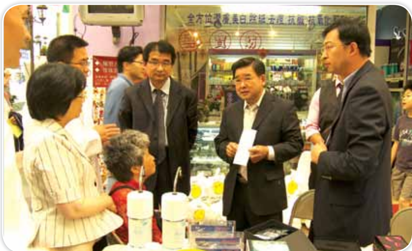
紐約市議員顧雅明來到新唐人健康博覽會關心巡視每一個展位，圖為顧雅明議員在開元公司展位旁同負責人馬經理（右一）及同仁們交談。