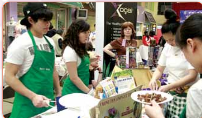
紐約承辦零售批發寄貨業務的唯一素食店美華素食店，提供了豐富的溫暖的美食