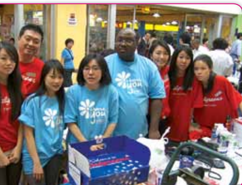
連鎖店 Walgreens 當天提供免費血壓測量，圖為員工合影