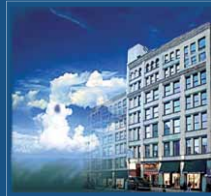
41 Elizabeth Street

Contemporary Office Space, In the Heart of Chinatown's Financial District Office Space Available for Lease from 1,000 SF - 6,500 SF Additional Space Available at : 40 Elizabeth Street 161 Canal Street