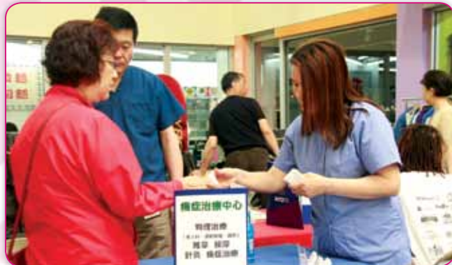
專治老人科運動損傷和矯形的痛症治療中心為觀眾免費物理治療 Physical Therapy Associates of Queens，該中心提供推拿、按摩、針灸和痛症治療