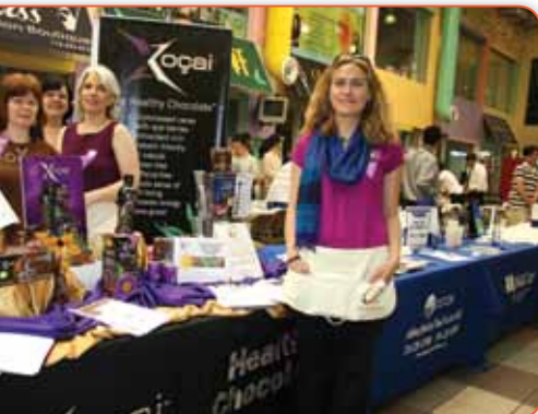
瓦力員工展示了多種健康巧克力，他們介紹 XOCA 巧克力免疫力、牙齦消炎功效等功效