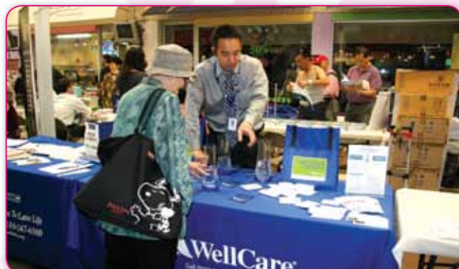
WellCare 維家保健介紹他們的服務有對低收入人士的援助，可享受聯邦醫療保險 (Medicare) 醫療補助 (Medicaid)，華裔新移民可以負擔的醫療保健服務