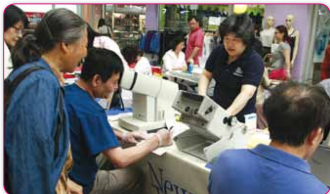
紐約皇后區醫院 New York Hospital Queens 為人們免費檢查青光眼