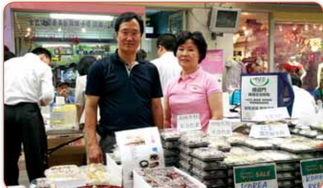
禮迎門韓國正晶糕點經理夫婦帶來他們 100% 無色素無防腐劑糕點，讓人們享受韓國宮廷風味