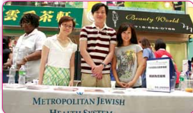
大都會猶太醫療機構 Metropolitan Jewish Health System 負責人介紹他們歡迎華裔老人家享受他們的服務