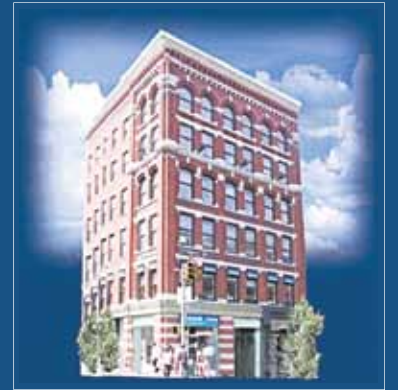
168 Canal Street

時尚辦公大樓出租 紐約中國城商業中心 最佳黃金地段 從1,000尺至6,500尺