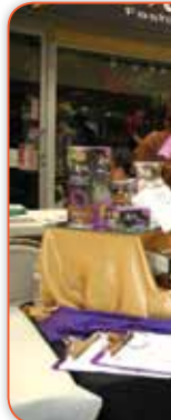
XOCAI 健康巧克力有減肥、提高免