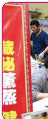
百通 -- 藏蒸堂負責並提供了藏蒸堂