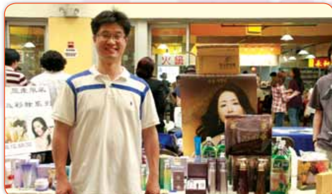
韓國山心化妝品公司負責人展示了他們精緻的化妝品和護膚護髮系列